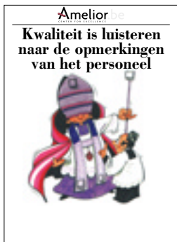
Nr. 11 Kwaliteit is luisteren naar de opmerkingen van het personeel