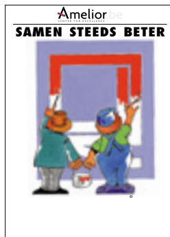
Nr. 13 Samen steeds beter