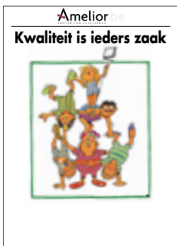
Nr. 31 Kwaliteit is ieders zaak