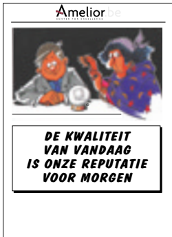
Nr. 21 De kwaliteit van vandaag is onze reputatie voor morgen