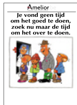
Nr. 19 Je vond geen tijd om het goed te doen, zoek nu maar tijd om het over te doen