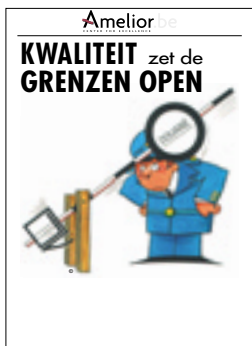
Nr. 6 Kwaliteit zet de grenzen open