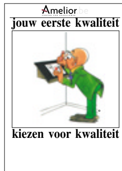
Nr. 28 Jouw eerste kwaliteit ... kiezen voor kwaliteit