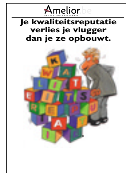
Nr. 29 Je kwaliteitsreputatie verlies je vlugger dan je ze opbouwt