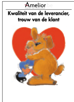
Nr. 2 Kwaliteit van de leverancier, trouw van de klant