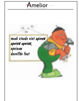
Nr. 25 Maak steeds niet opnieuw opnieuw opnieuw dezelfde fout