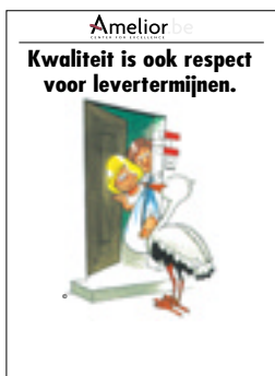
Nr. 16 Kwaliteit is ook respect voor levertermijnen