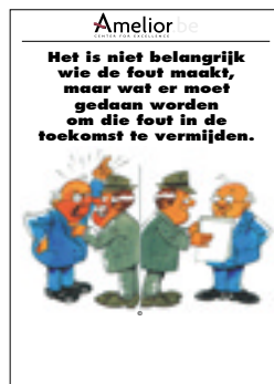
Nr. 33 Het is niet belangrijk wie de fout maakt, ...