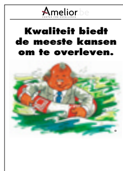
Nr. 38 Kwaliteit biedt de meeste kansen om te overleven