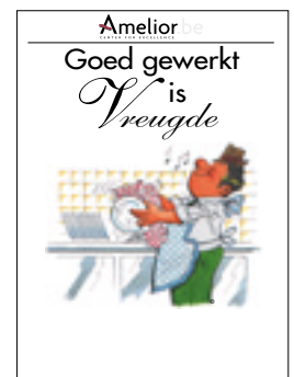
Nr. 20 Goed gewerkt is vreugde