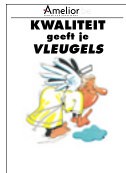
Nr. 9 Kwaliteit geeft je vleugels