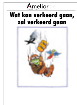
Nr. 14 Wat kan verkeerd gaan, zal verkeerd gaan