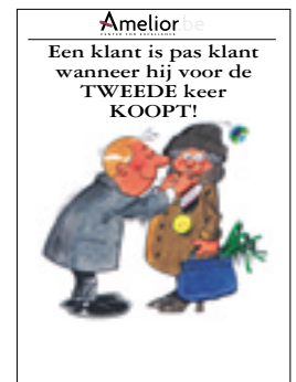
Nr. 10 Een klant is pas klant als hij voor de 2e maal koopt