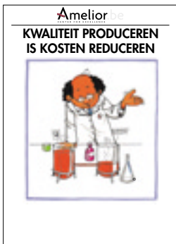
Nr. 26 Kwaliteit produceren is kosten reduceren