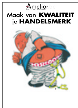
Nr. 12 Maak van kwaliteit je handelsmerk