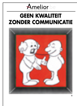
Nr. 32 Geen kwaliteit zonder communicatie