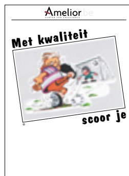
Nr. 37 Met kwaliteit scoor je