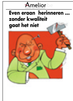
Nr. 23 Even eraan herinneren... zonder kwaliteit gaat het niet