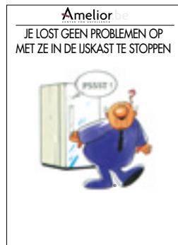
Nr. 27 Je lost geen problemen op met ze in de ijskast te stoppen