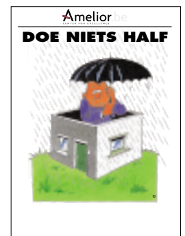
Nr. 40 Doe niets half