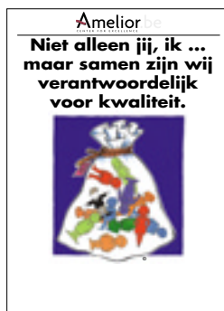
Nr. 18 Niet alleen jij, ik ... maar samen zijn wij verantwoordelijk voor kwaliteit