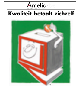
Nr. 24 Kwaliteit betaalt zichzelf