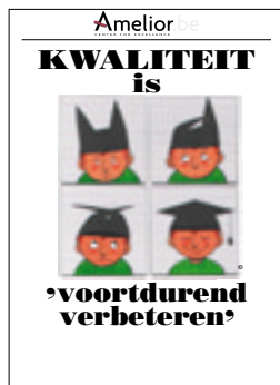
Nr. 7 Kwaliteit is voortdurend verbeteren