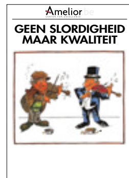
Nr. 34 Geen slordigheid maar kwaliteit