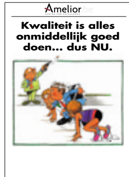
Nr. 22 Kwaliteit is alles onmiddellijk goed doen... dus NU