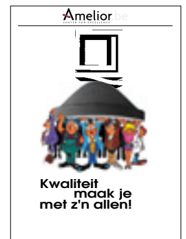
Nr. 35 Kwaliteit maak je met z'n allen