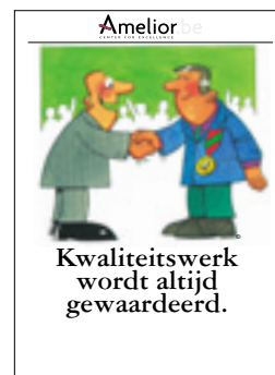
Nr. 39 Kwaliteitswerk wordt altijd gewaardeerd