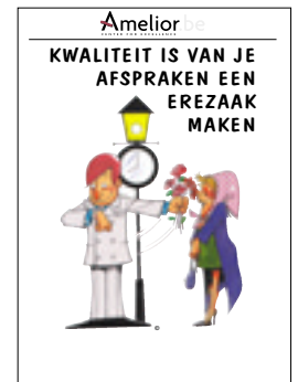
Nr. 30 Kwaliteit is van je afspraken een erezaak maken