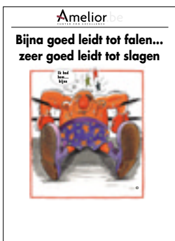
Nr. 36 Bijna goed leidt tot falen ... zeer goed leidt tot slagen