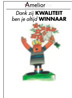
Nr. 4 Dankzij kwaliteit, altijd winnaar