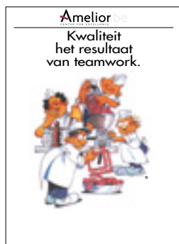
Nr. 17 Kwaliteit het resultaat van teamwork