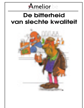
Nr. 15 De bitterheid van slechte kwaliteit