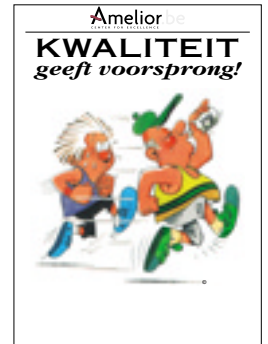
Nr. 5 Kwaliteit geeft voorsprong