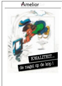
Nr. 3 Kwaliteit, de nagel op de kop