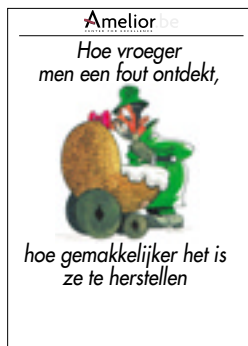
Nr. 8 Hoe vroeger men een fout ontdekt, hoe gemakkelijker het is ze te herstellen